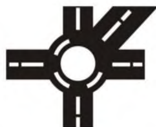
с круговым движением

Перекрестком называется место пересечения, примыкания или разветвления дорог на одном уровне. Пересечение дорог – очень сложное опасное место, там часто случаются различные происшествия, поэтому и водителям, и пешеходам необходимо быть очень внимательными.