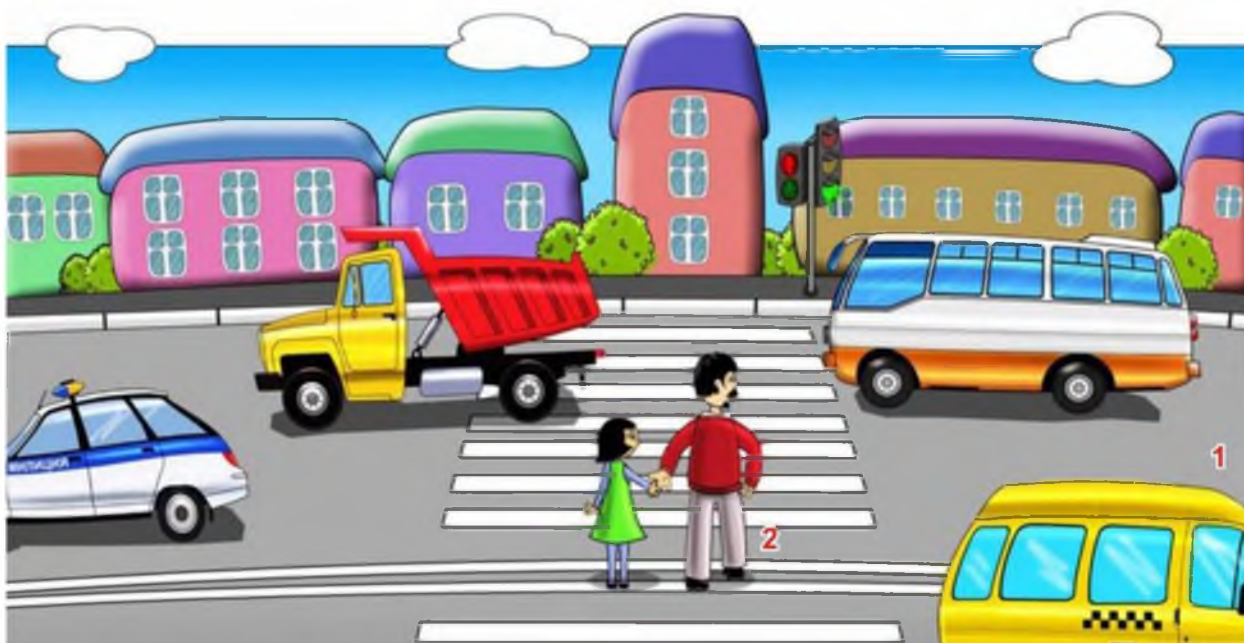
Участники дорожного движения: 1 - водители 2 - пешеходы

Выйдя из подъезда своего дома, ты становишься пешеходом и имеешь цель движения и место, куда направляешься. Помимо цели, каждый выбирает для пешеходного движения свой маршрут. Мы стараемся, чтобы маршрут движения был как можно более удобным и безопасным. Маршрут – это путь нашего движения к цели.